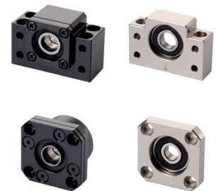
Lagereinheiten für Spindeln Seite 474