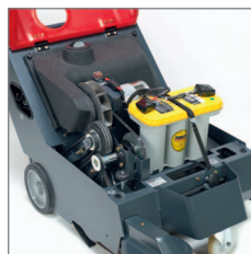
Das Innere der Maschine mit wartungsfreier Batterie.