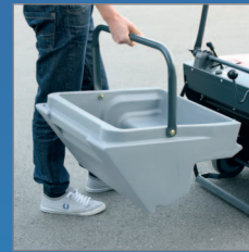
Dieser Schmutzbehälter ist immer im Gleichgewicht und kippt erst, wenn Sie das möchten.