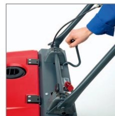
Hebel Seitenbesen absenken / anheben.