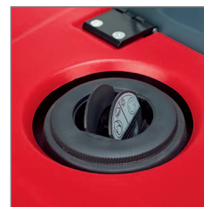
Bypass-Klappe Durch das Öffnen wird die Absaugung unterbrochen. Dadurch kann feuchtes Kehrgut optimal aufgenommen werden.