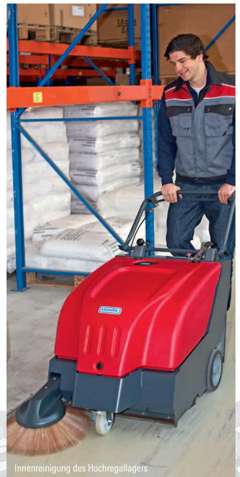
Innenreinigung des Hochregallagers