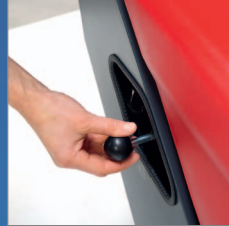
Filterreinigung durch hin- und herbewegen des Hebels.