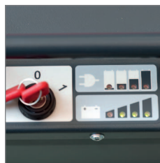
Batterie- und Onboard Ladegerät Anzeige inkl. Tiefentladeschutz. Verhindert komplette Entleerung der Batterie.