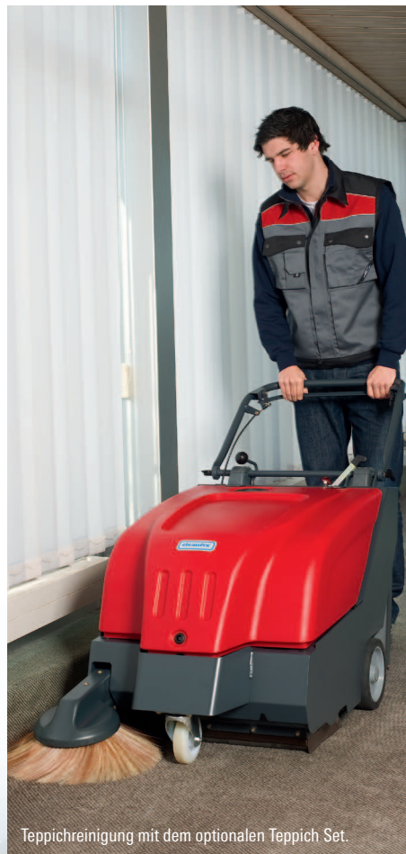
Teppichreinigung mit dem optionalen Teppich Set.