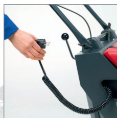
Einfaches Aufladen dank Onboard Ladegerät.