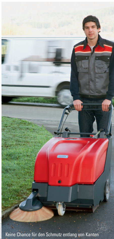
Keine Chance für den Schmutz entlang von Kanten