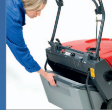
Einfaches Herausziehen des Schmutzbehälters.