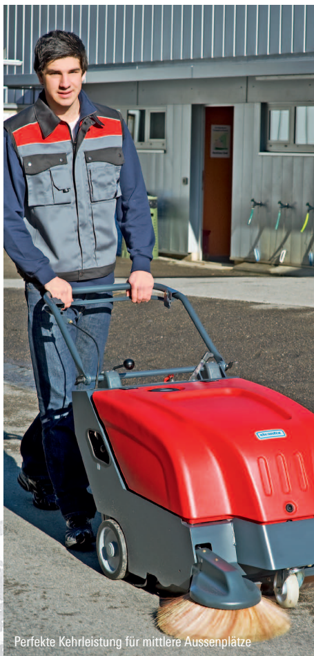
Perfekte Kehrleistung für mittlere Aussenplätze