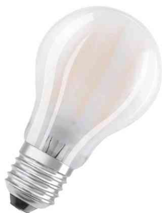
Visuel de référence: Ampoule LED CLASSIC A, mat

- utilisation à l'extérieur uniquement avec des lampes externes (minimum IP65)