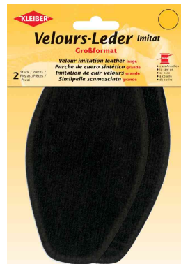
Patch imitation cuir velours, brun foncé