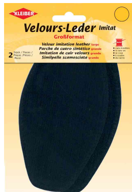
Patch imitation cuir velours, bleu foncé