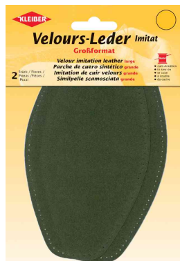
Patch imitation cuir velours, olive