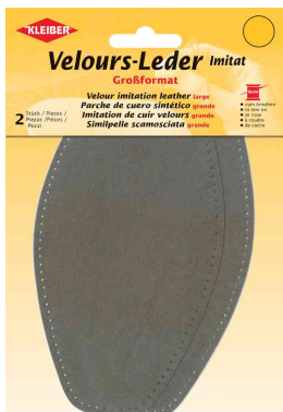
Patch imitation cuir velours, taupe