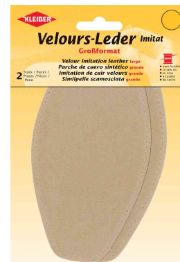
Patch imitation cuir velours, sable