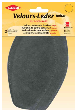
Imitation de cuir velours, gris moyen

lavage à la main jusqu'à 40 °C max., pas de javel, pas de séchage au sèche-linge, repassage possible position 1 ou jusqu'à une température maximale de 110 °C, pas de nettoyage à sec