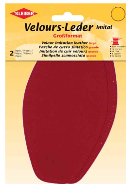
Patch imitation cuir velours, rouge