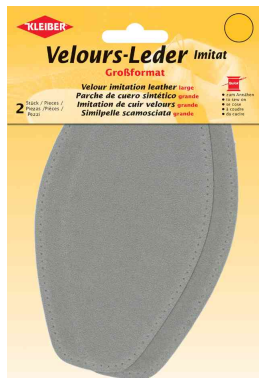
Patch imitation cuir velours, beige