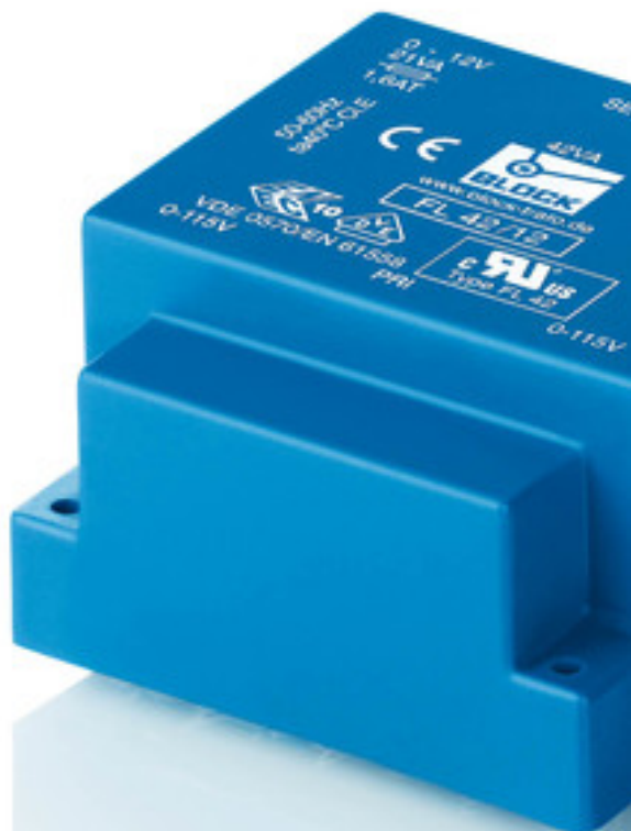
Abbildung zeigt FL 42/12