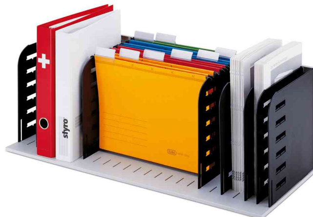
Visuel de référence: Unité de base styrorac, gris/noir (livré non équipé)