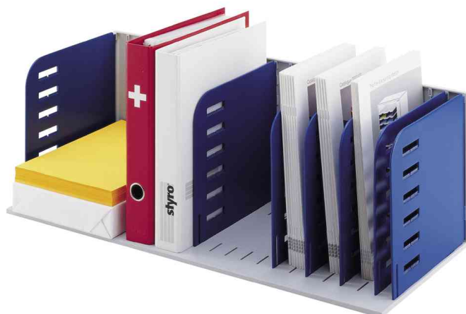
Visuel de référence: Unité de base styrorac, gris/bleu (livré non équipé)