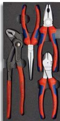
00 20 01 V01

Ordnung halten leicht gemacht: Drei Zangensets in zweifarbiger Schaumstoffeinlage.