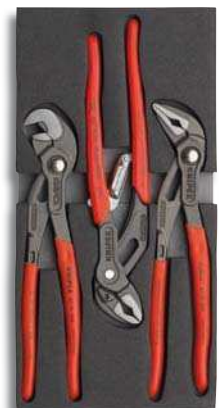
00 20 01 V03