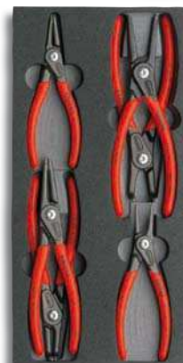
00 20 01 V02