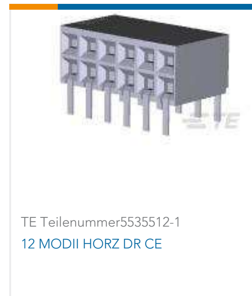
TE Teilenummer5535512-1 12 MODII HORZ DR CE