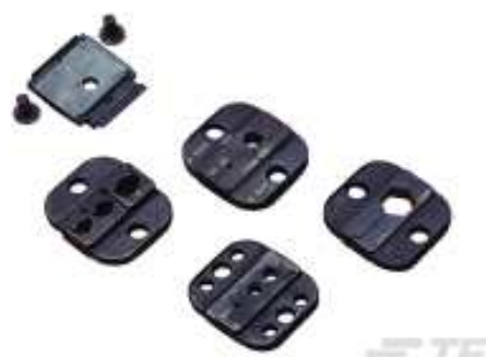
TE Teilenummer 58545-3 SDE DIE ASSY. 22-10 SOLISTRAND