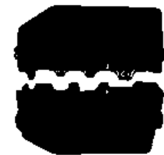
TE Teilenummer 539662-2 MATR SOLISTR 0,3-6,