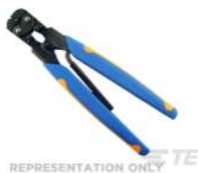
TE Teilenummer 574573 22-10 1-9 W TYPE D.A.H.T. ASSY