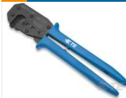
TE Teilenummer 169400 CERTI-LOK