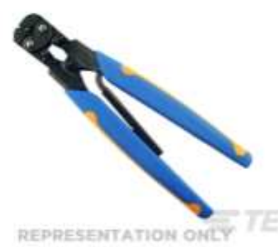
TE Teilenummer 49935 DAHT SOLIS 22-10