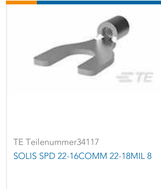
TE Teilenummer34117 SOLIS SPD 22-16COMM 22-18MIL 8