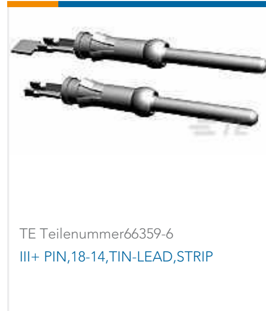
TE Teilenummer66359-6 III+ PIN,18-14,TIN-LEAD,STRIP