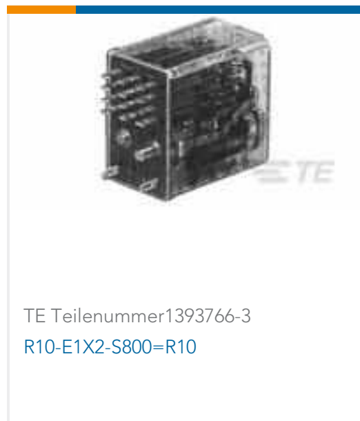
TE Teilenummer1393766-3 R10-E1X2-S800=R10