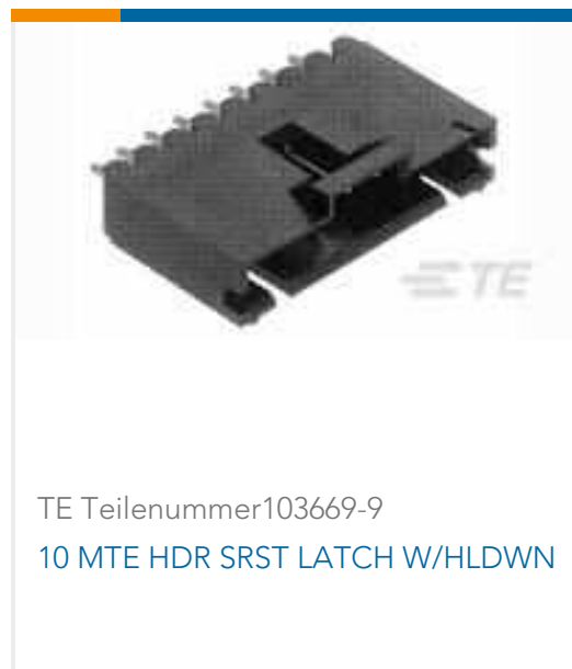
TE Teilenummer103669-9 10 MTE HDR SRST LATCH W/HLDWN