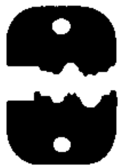
TE Teilenummer 58545-1 SOLISTRAND 10-22 DIE ASSY