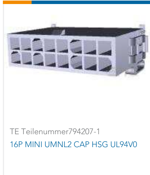
TE Teilenummer794207-1 16P MINI UMNL2 CAP HSG UL94V0