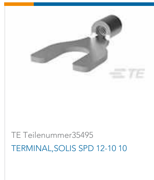
TE Teilenummer35495 TERMINAL,SOLIS SPD 12-10 10