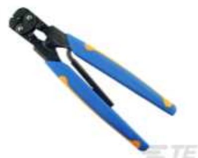
TE Teilenummer 525693 22-10 TYPE W D.A.H.T. ASSY