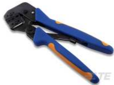
TE Teilenummer 58546-1 PC 22-10 SOLISSPICE SPL I SHT