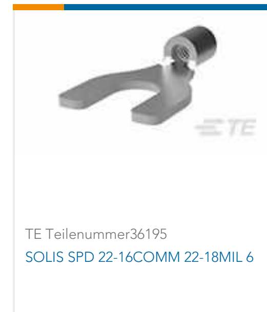
TE Teilenummer36195 SOLIS SPD 22-16COMM 22-18MIL 6