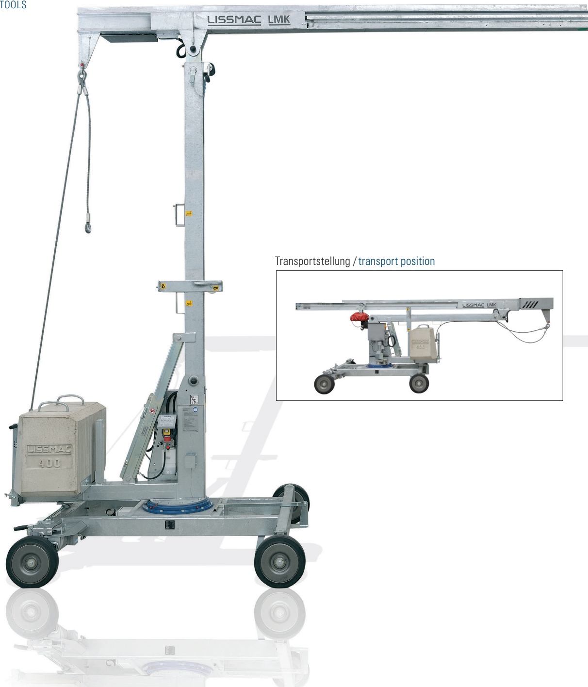
Transportstellung / transport position