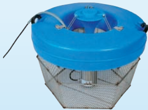
Aqua-Pilz mit Tauchmotor