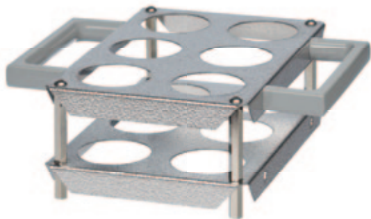
SG 6 B