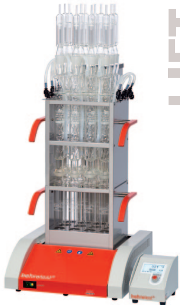
CSB/SMA 12 L