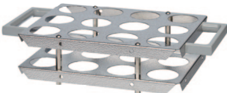
SG 12 B