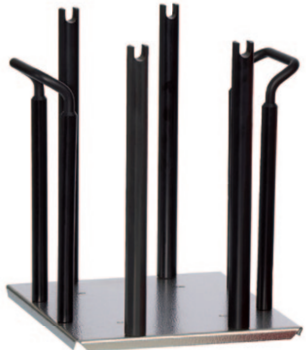
TS 12 SM