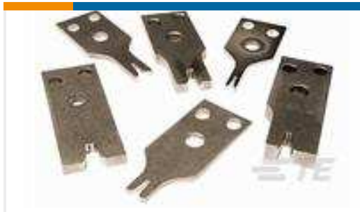
TE Teilnr.:8-1424909-7 CRIMPER, INSULATION "F"(.220")