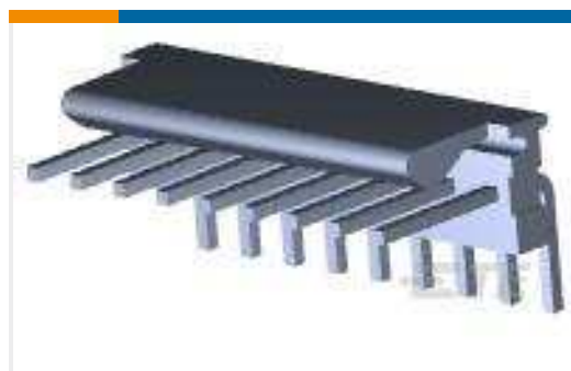
TE Teilnr.:3-641216-9 09P MTA100 HDR ASSY FL/RA LF