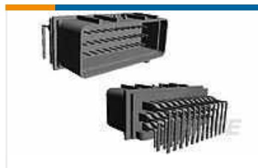
TE Teilnr.:346350-5 36 WAY ECONOSEAL III HDR.RED