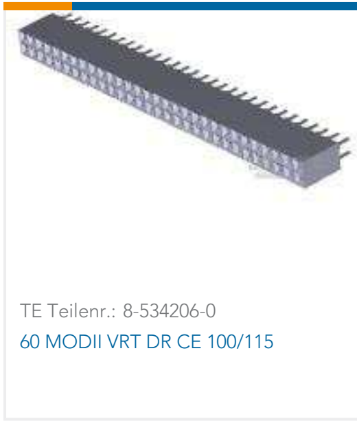
TE Teilnr.: 8-534206-0 60 MODII VRT DR CE 100/115