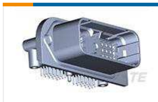
TE Teilnr.:DRC23-40PB-N012 HDR, 40P, BLK, RA, AU/NI/CU, B