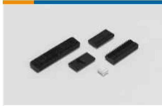
Kabel-an-Leiterplatte-Steckverbindersätze und -gehäuse(5)