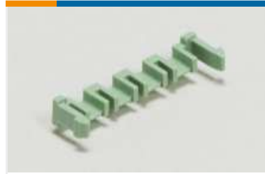
Laschen, Verriegelungen und Arretierungen für Leiterplatten(2)