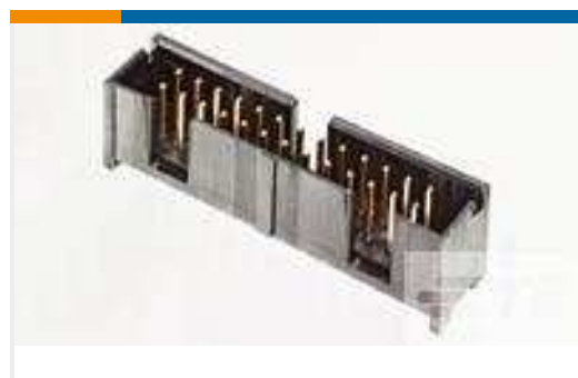
TE Teilnr.:3-1761603-2 IDC LOW PRO HDR 36P VERT BLUE