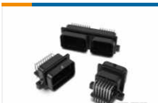
TE Teilnr.:6473418-1 SUPERSEAL Steckverbinder-Stiftleisten: 1,0 mm