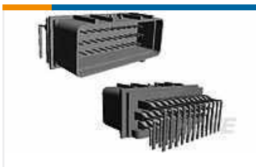
TE Teilnr.:344108-1 36 WAY HEADER WIRE TO BD.FOR E