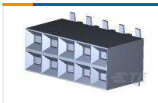
TE Teilnr.:5-147105-5 10 MODIV VRT DR SFMNT 30AU