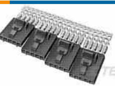
TE Teilenummer103958-7 2X8 MTE RCPT SR LATCH .100CL