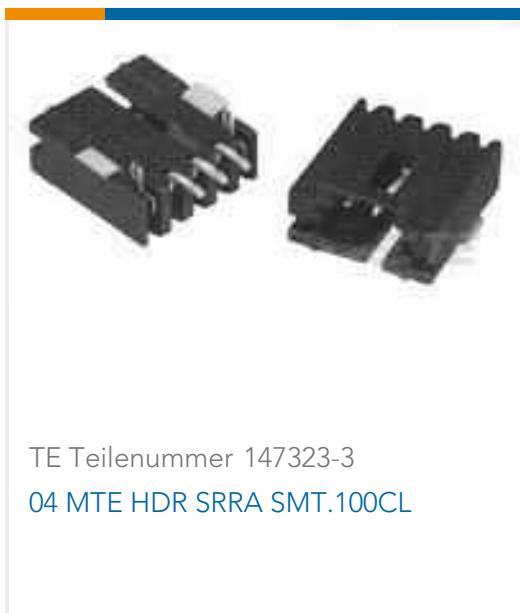
TE Teilenummer 147323-3 04 MTE HDR SRRA SMT .100CL