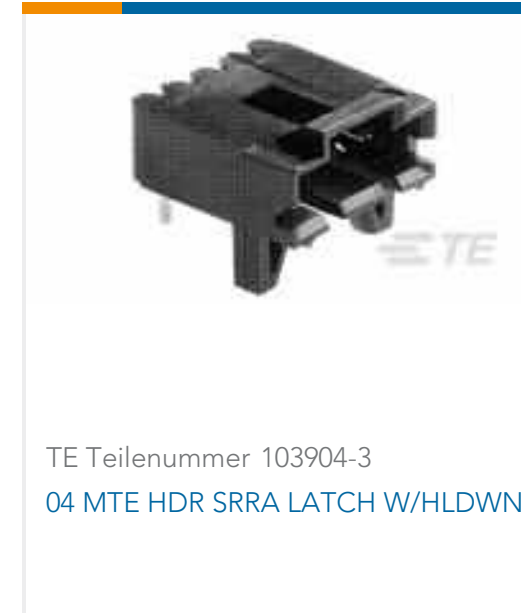
TE Teilenummer 103904-3 04 MTE HDR SRRA LATCH W/HLDWN