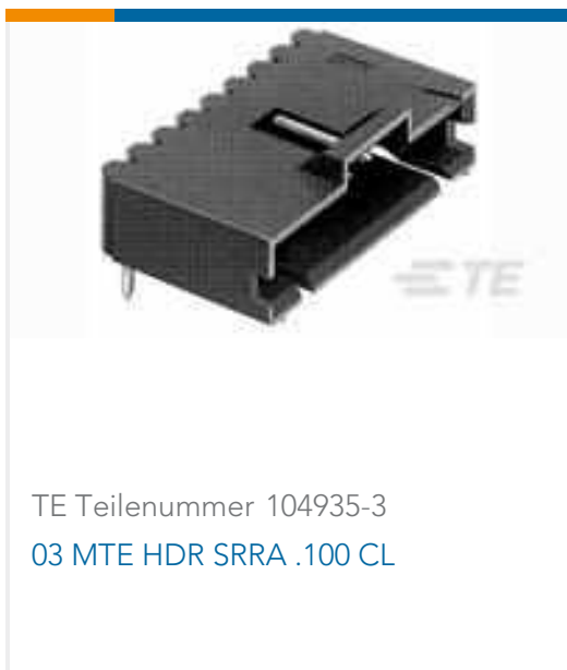
TE Teilenummer 104935-3 03 MTE HDR SRRA .100 CL