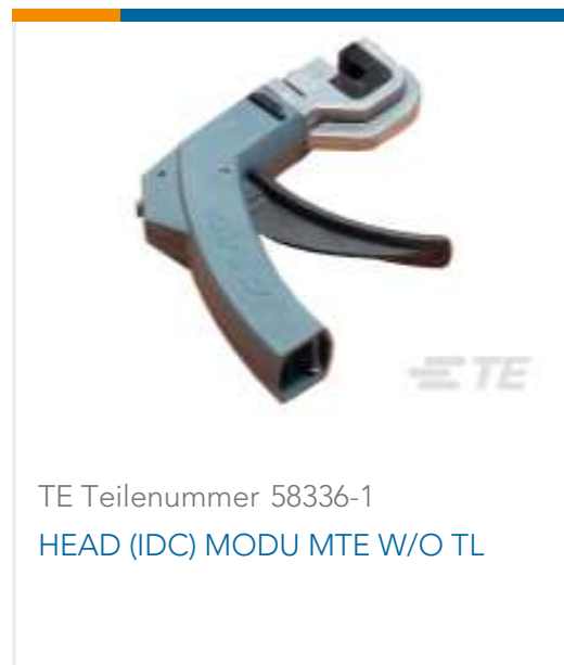
TE Teilenummer 58336-1 HEAD (IDC) MODU MTE W/O TL