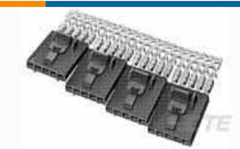
TE Teilenummer103958-4 4X5 MTE RCPT SR LATCH .100CL