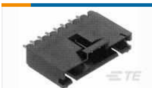
TE Teilenummer103908-3 04 MTE HDR SRST LATCH W/HLDWN