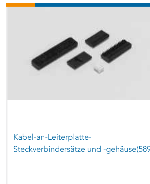
Kabel-an-Leiterplatte-Steckverbindersätze und -gehäuse(589)