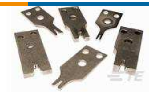
TE Teilenummer2-456135-4 CRIMPER, INSULATION "O" (.120")