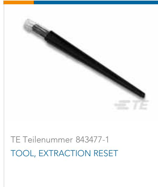
TE Teilenummer 843477-1 TOOL, EXTRACTION RESET