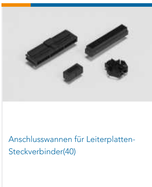
Anschlusswannen für Leiterplatten-Steckverbinder(40)