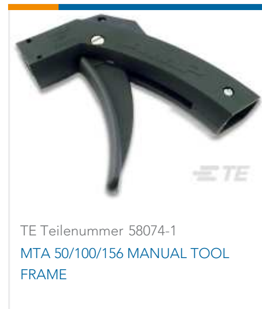
TE Teilenummer 58074-1 MTA 50/100/156 MANUAL TOOL FRAME