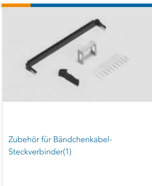
Zubehör für Bändchenkabel-Steckverbinder(1)