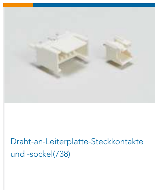
Draht-an-Leiterplatte-Steckkontakte und -socket(738)