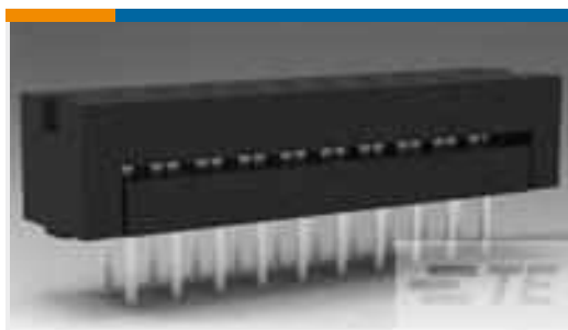
TE Teilenummer746610-3 016 DIP PLUG 100CL TIN