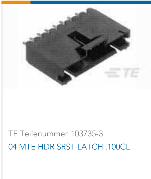
TE Teilenummer 103735-3 04 MTE HDR SRST LATCH .100CL