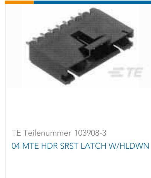
TE Teilenummer 103908-3 04 MTE HDR SRST LATCH W/HLDWN