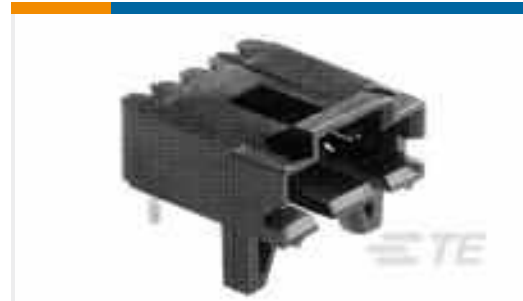
TE Teilenummer103904-1 02 MTE HDR SRRA LATCH W/HLDWN