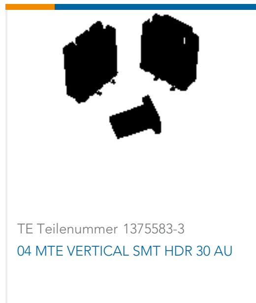
TE Teilenummer 1375583-3 04 MTE VERTICAL SMT HDR 30 AU