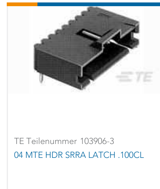
TE Teilenummer 103906-3 04 MTE HDR SRRA LATCH .100CL