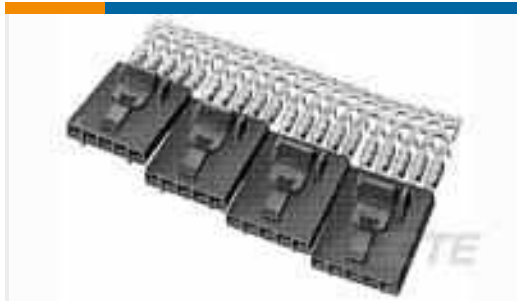
TE Teilenummer103958-2 8X3 MTE RCPT SR LATCH .100CL