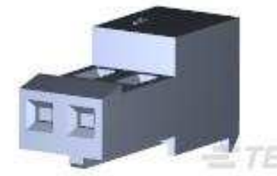
TE Teilenummer3-641237-2 02P MTA100 CONN ASSY RED 30AU