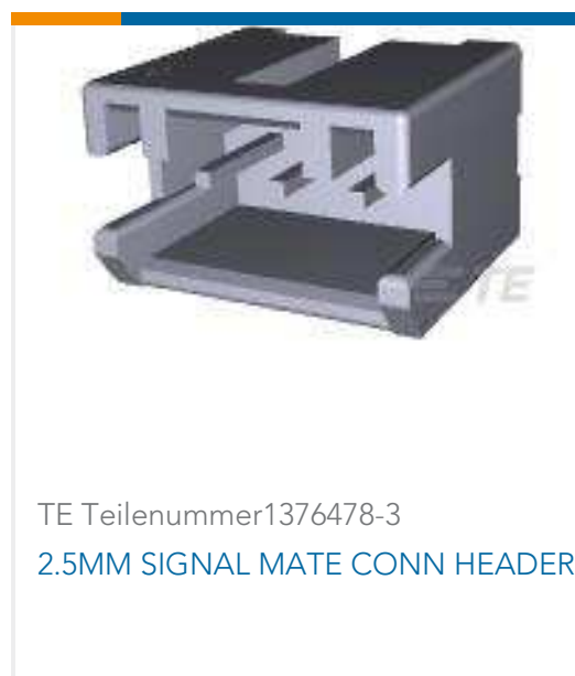
TE Teilenummer1376478-3 2.5MM SIGNAL MATE CONN HEADER