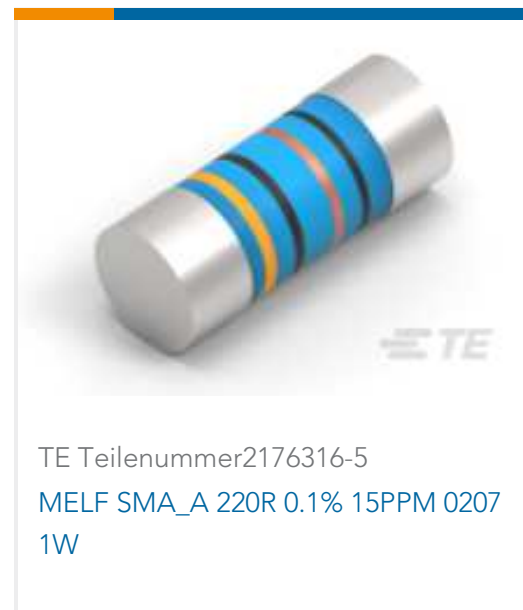
TE Teilenummer2176316-5 MELF SMA_A 220R 0.1% 15PPM 0207 1W