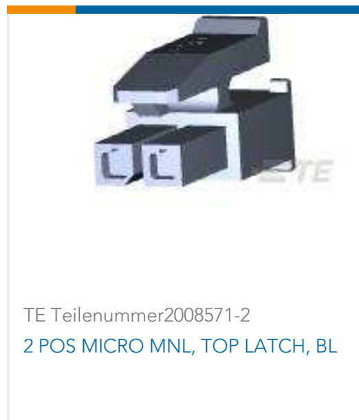
TE Teilenummer2008571-2 2 POS MICRO MNL, TOP LATCH, BL