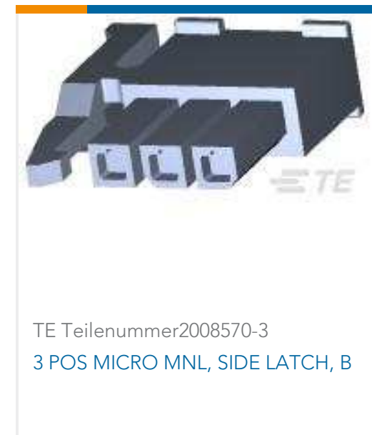
TE Teilenummer2008570-3 3 POS MICRO MNL, SIDE LATCH, B