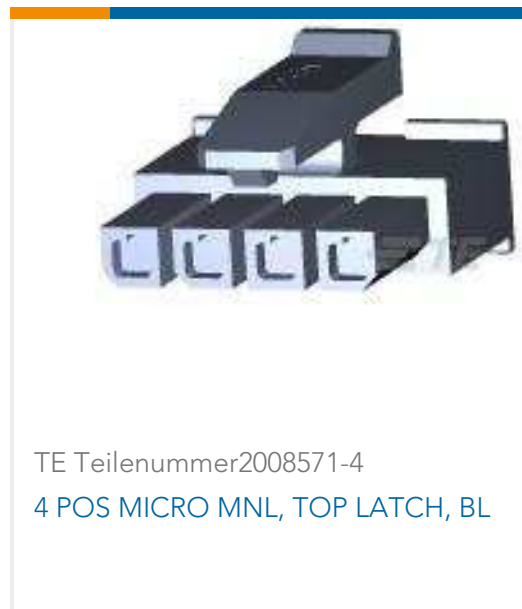
TE Teilenummer2008571-4 4 POS MICRO MNL, TOP LATCH, BL