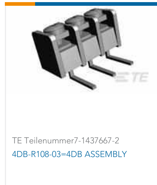
TE Teilenummer7-1437667-2 4DB-R108-03=4DB ASSEMBLY