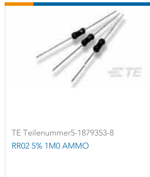
TE Teilenummer5-1879353-8 RR02 5% 1M0 AMMO