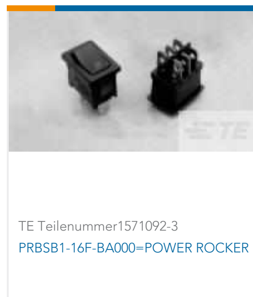
TE Teilenummer1571092-3 PRBSB1-16F-BA000=POWER ROCKER