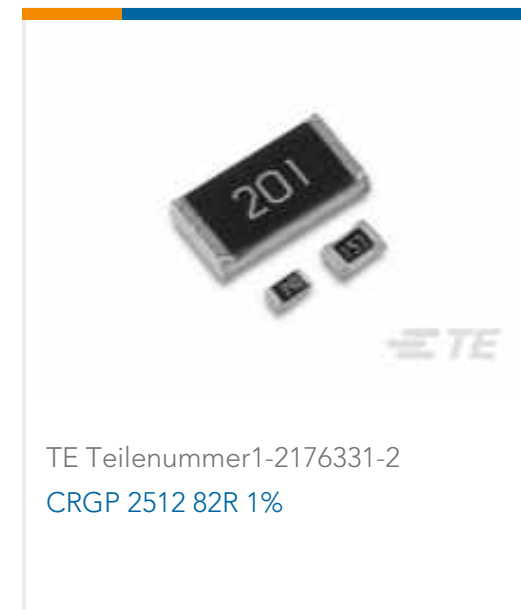
TE Teilenummer1-2176331-2 CRGP 2512 82R 1%