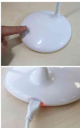
Visuel de référence: Interrupteur tactile / chargement par USB