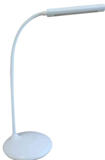
Lampe de bureau à LED sans fil NELLY

- lampe pratique où que soyez - bureau, salle de réunion ou chambre d'hôtel