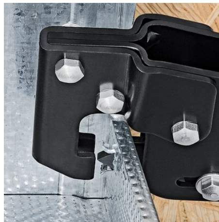
Posizionamento della punzonatrice su due profili di lamiera da unire