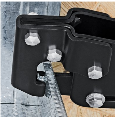
Il punzone viene premuto attraverso i profili in lamiera

Con riserva di modifiche tecniche e salvo errori