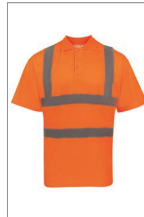
KXPCPOLOO Orange (Vorne) S - 7XL