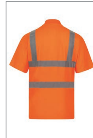
KXPCPOLOO Orange (Hinten) S - 7XL