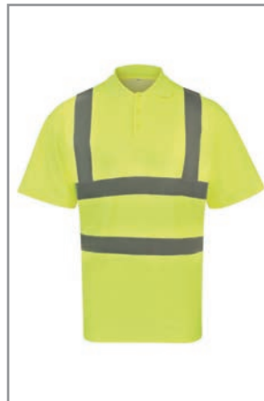
KXPCPOLOG Gelb S - 7XL

Industrie, Transport und Logistik, Brandschutz, Events, Bau, Behörden, Flughäfen, Security