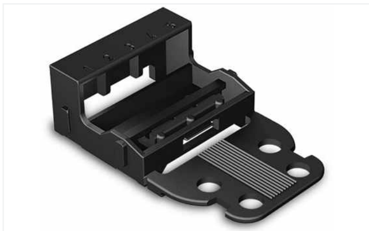
Farbe: ■ schwarz