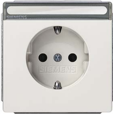
DELTA style rot (WSV) SCHUKO Kinderschutz und Schriftfeld 68x68mm 10/16A 250V