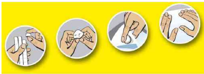
abziehen - kneten - anbringen - fixieren