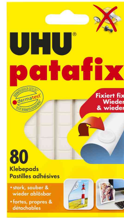
Klebe pads patafix, weiß