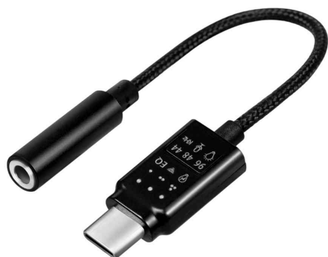
USB-C - Audio-Adapter mit EQ, 140 mm Kabel