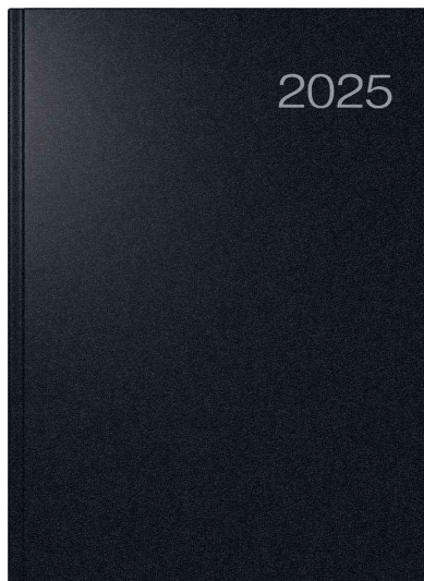
Agenda planning "Conform Balacron", noir