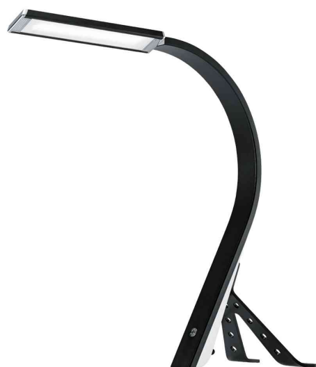
Lampe de bureau à LED Swing