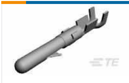
TE Teilnr.:60620-1 CMNL PIN 20-14 TPBR L/P