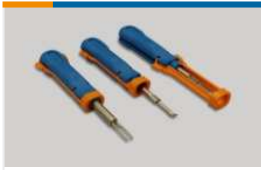
Einsetz- und Entriegelungswerkzeuge (6)