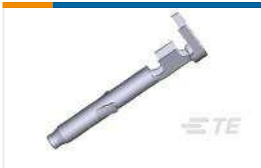
TE Teilnr.:170362-4 MINI UNIVERSAL M-N-L SOCKET