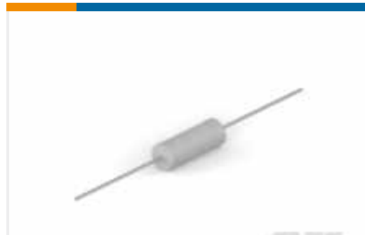
TE Teilnr.:7-2176412-3 5W XSM M/OX 5% 5K1