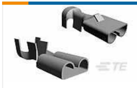
TE Teilnr.:170084-2 250 FASTON,REC.,18-14 AWG,TPPB