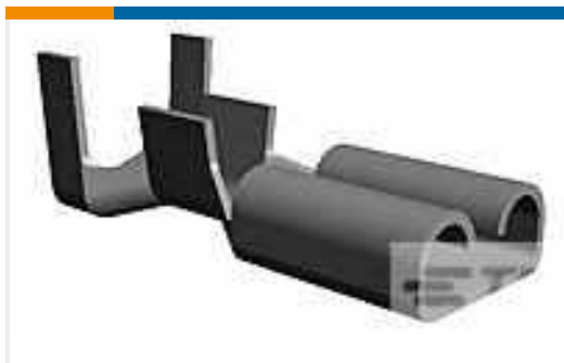
TE Teilnr.:170038-4 187 FASTON,REC.,20-16 AWG,TPPB