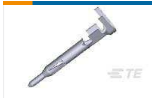
TE Teilnr.:170360-4 MINI UNIVERSAL M-N-L PIN