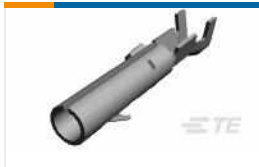
TE Teilnr.:61314-4 CMNL SOK 24-18 TPPHBZ