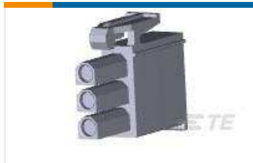
TE Teilnr.:172337-1 MINI UMNL PLUG HOUSING 3P