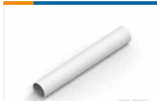
TE Teilnr.:NB19792001 RNF-100-3/32-WH-STK