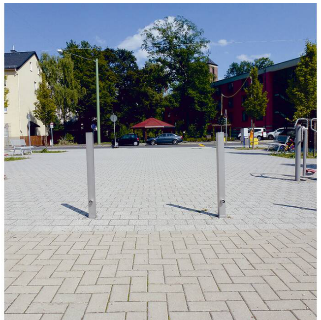
Anwendungsbeispiel: Absperrpfosten -Bollard- mit Dreikantschloss (Art. 4070f)