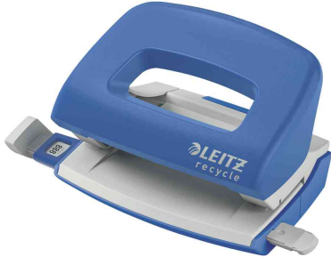
Locher Mini NeXXt Recycle, blau