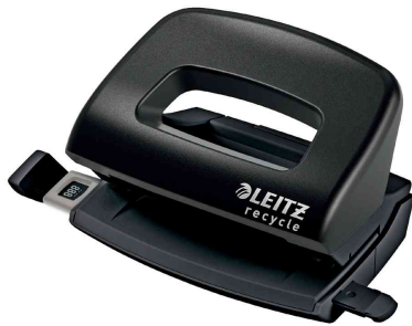
Locher Mini NeXXt Recycle, schwarz