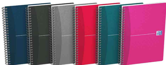
Office Carnet à spirales "Essentials"