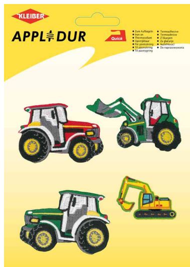
Assortiment d'applications "Vehicules 1"

Veillez respecter les consignes d'entretien et celles du vêtement. Les indications se réfèrent aux applications.