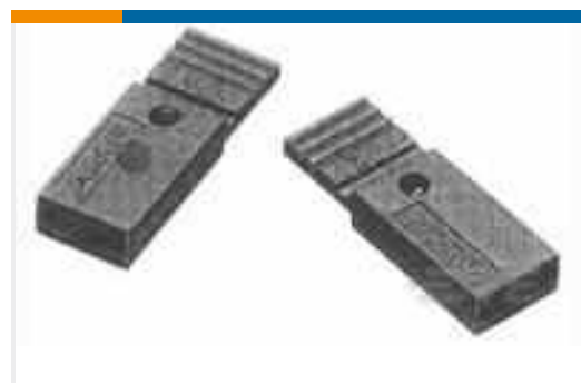
TE Teilnr.:881545-2 SHUNT LP W/HANDLE 2 POS 30AU