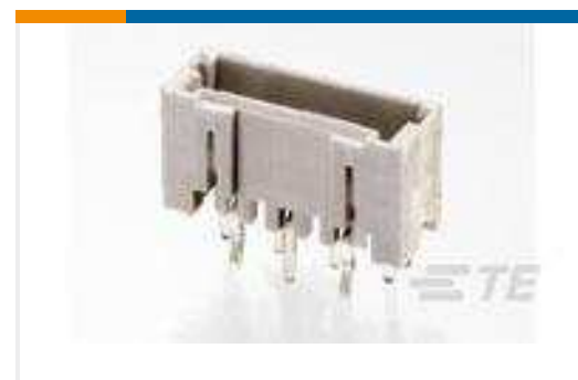
TE Teilnr.:292207-6 MINI CT SGL DIP V 6P NAT