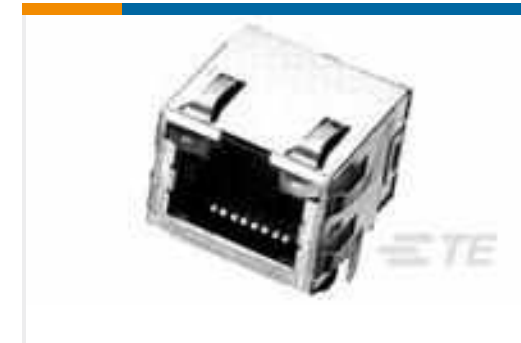
TE Teilnr.:2-406549-1 IMJ,1X1,PNL GRD,LED(G/Y), SN