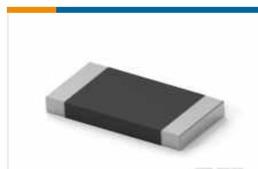
TE Teilnr.:5-2176422-6 TLRP 2512 3.0W R015 1% 50PPM 4K RL