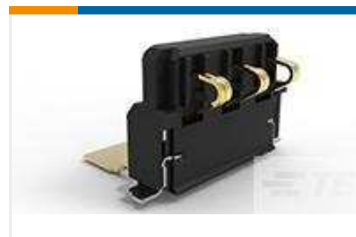
TE Teilnr.:1981061-1 LEAF BATTERY CONN W/B 3POS. P=3.2, PKG