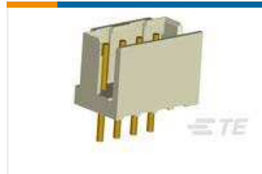
TE Teilnr.:1-292132-2 CT P/HDR BOX V 12P NAT