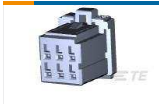
TE Teilnr.:1-1827864-3 DYNAMIC 1200D REC HSG 6P X BLACK