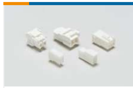
Rechteckige Leistungssteckverbinder (169)