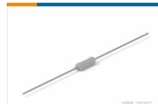
TE Teilnr.:2-1676123-4 1/2W SM M/OX 5% 7R5