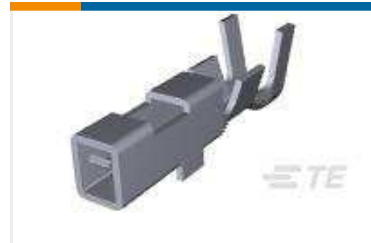
TE Teilnr.:1827587-2 DYNAMIC D1000 REC CONT M AU 0.38um L/P