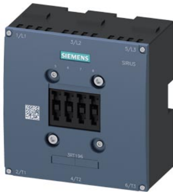
Lichtbogenkammer für 3RT1065