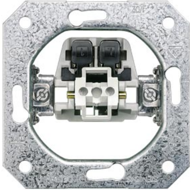
DELTA Geräteinsatz UP Ausschalter 1-polig 10A 250V