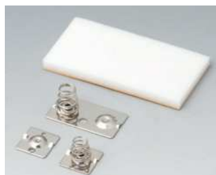
A9176007 Kontaktfedern-Set, 2 x AA Stahl vernickelt

Technische Änderungen vorbehalten. © OKW Gehäusesysteme, Buchen/Deutschland.