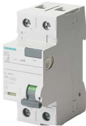
FI-SCHUTZSCHALTER TYP A 16A 1+N-POL 10MA 230V 2TE N-LINKS