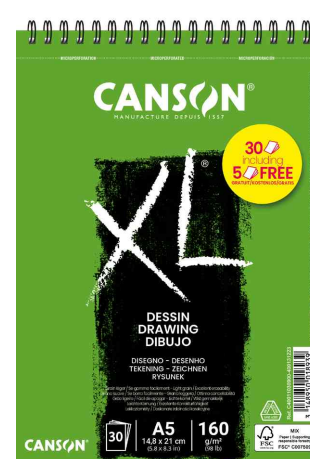
Bloc croquis et études "XL DESSIN", Offre Spéciale - A5