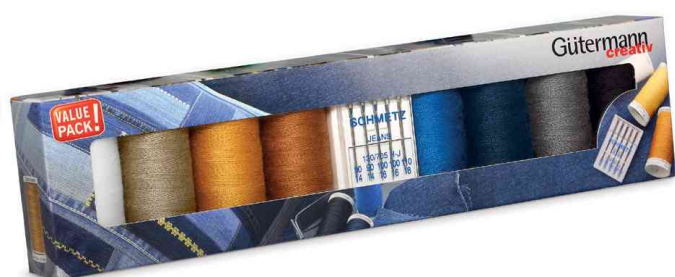
Set de fils à coudre "Denim" avec aiguilles spéciales jeans, 8 bobines