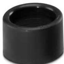
Endtüllen als Kabelschutz

Bitte beachten Sie, dass die in diesem PDF-Dokument angezeigten Daten aus unserem Online-Katalog generiert wurden. Bitte finden Sie die vollständigen Daten in der Benutzer-Dokumentation. Es gelten unsere Allgemeinen Nutzungsbedingungen für Downloads.