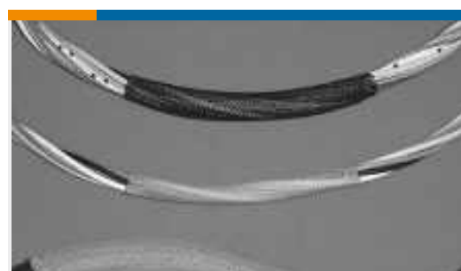
TE Teilnr.:F886364001 VERSAFLEX-FR-3/8-09-SP