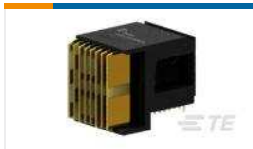
TE Teilnr.:1410189-3 MULTIGIG RT T2 7RW H-LFT,ET2