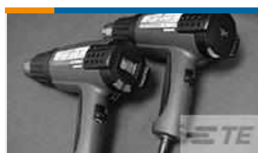
TE Teilnr.: CJ2087-000 HL2010E-KIT-120V