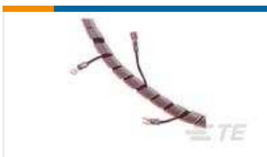
TE Teilnr.:500004-1 SPIRAP 1/4" FR PE, WHITE, 50FT