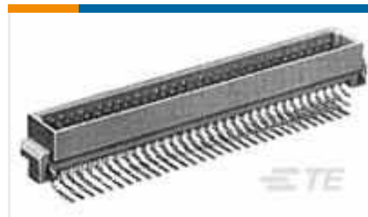
TE Teilnr.:5650947-5 ASSY,PIN,EUROCARD,TYPE C,LEAD-