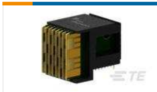
TE Teilnr.:1410971-3 MULTIGIG RT T2 7RW H-LFT RTM