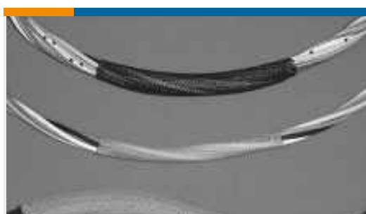
TE Teilnr.:E586024001 VERSAFLEX-FR-1/2-09-SP