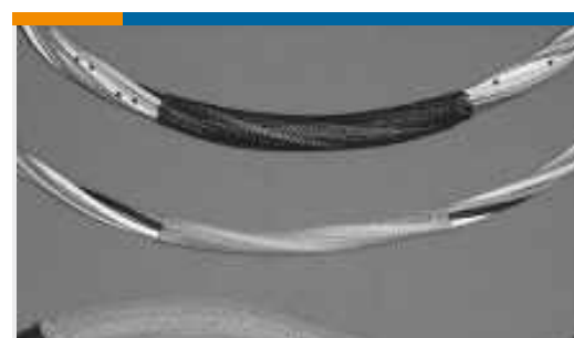
TE Teilnr.:E776944001 VERSAFLEX-FR-1/8-09-SP