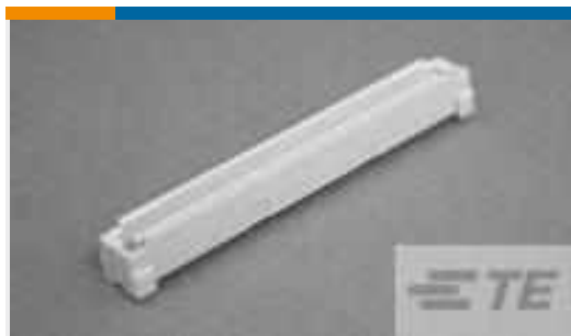
TE Teilnr.:5179029-6 0.8FH,P06H.5,140,08/Sn,TU