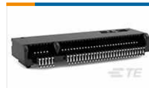
TE Teilnr.:2199119-4 M.2 0.5PITCH 3.2H KEY E 15U" AU