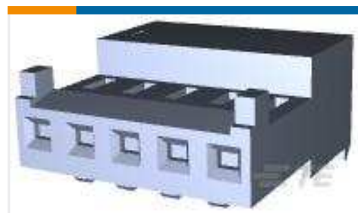
TE Teilnr.:3-643813-5 05P MTA100 CONN ASSY POL RIB