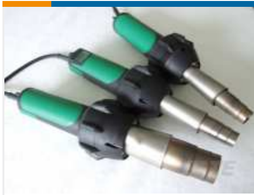
TE Teilnr.: EG1114-000 CV1981-ST-230V1600W-EU