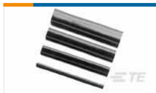
TE Teilnr.:CB5331-000 SST-48-07/226/NM