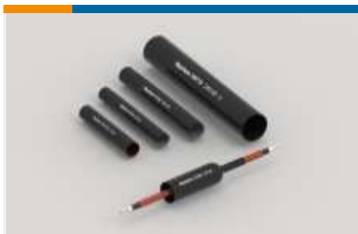
Schläuche und Zubehör für Stromkabel (8)