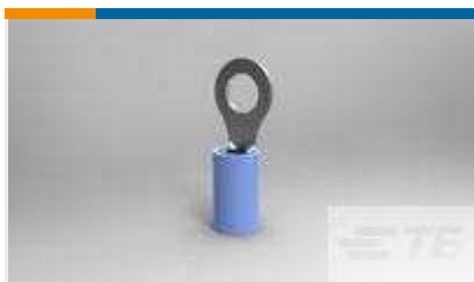
TE Teilnr.:36160 TERMINAL,PIDG R 16-14 10