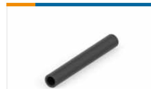
TE Teilnr.:NB17444001 RP-4800-NO.6-0-SP