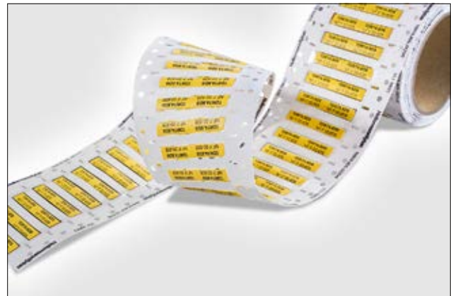
TDRT DS – dieselbeständiger Schrumpfschlauchmarkierer.