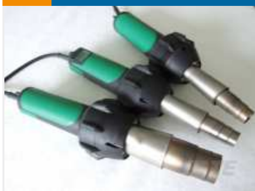
TE Teilnr.: EG1114-000 CV1981-ST-230V1600W-EU