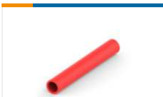
TE Teilnr.:1165384001 Doppelwandiger DWTC Warmschrumpfschlauch, Spule