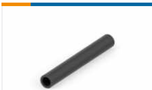
TE Teilnr.:EM8997-000 RBK-85-KIT-0510-A0