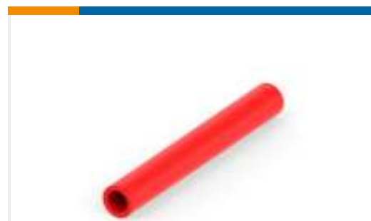
TE Teilnr.:EH16446001 ATUM-12/4-2-40MM