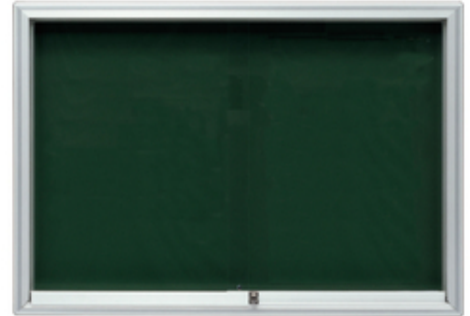
Anwendungsbeispiel: -Infomedia SM- mit Schiebetür, 1500 x 1000 mm