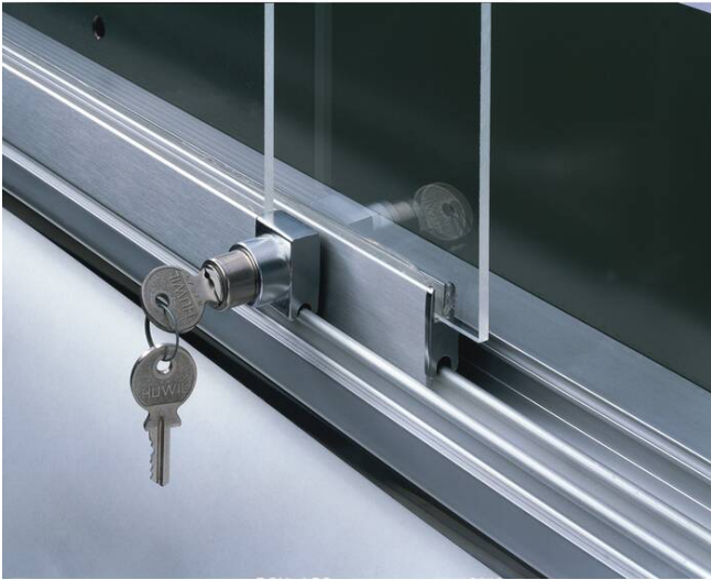
Modellbeispiel: Schiebetüren mit Sicherheitsschloss