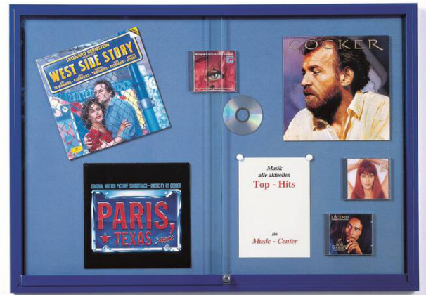
Anwendungsbeispiel: Magnettafel/Rahmen nach RAL lackiert