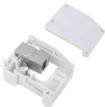
Adaptateur pour rail DIN avec 1 module Keystone