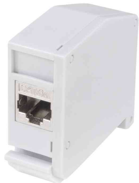
Adaptateur pour rail DIN avec 1 module Keystone