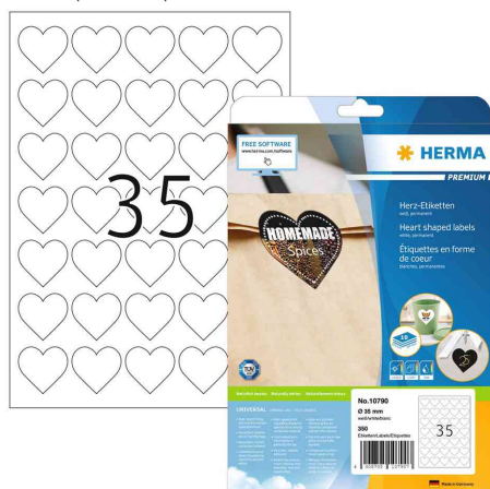
Étiquettes en forme de coeur (10790)