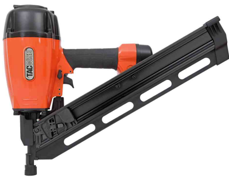
Clouuse coudée pneumatique KDH90V