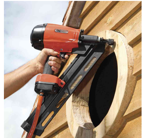
Visuel de référence : présente le produit en utilisation