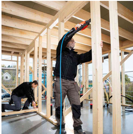
Visuel de référence : présente le produit en utilisation