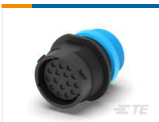
TE Teilnr.:HDP24-24-16SE-L015 REC, 16P, BLK, E, THD, 12, S