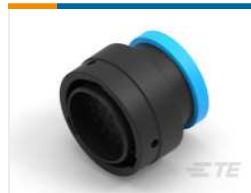
TE Teilnr.:YHDP26-24-35PEL017 PLG, 35P, BLK, E, RNG, 16/20, P