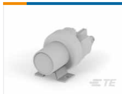
TE Teilnr.:K1008699 Relay 26-60-05