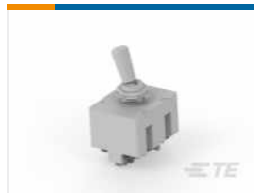
TE Teilnr.:K1002956 Toggle Switch 08-4-1-13