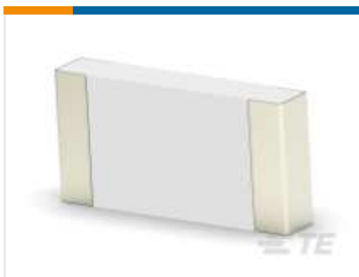
TE Teilnr.:2-2176245-2 CRGS1206 5% 56R