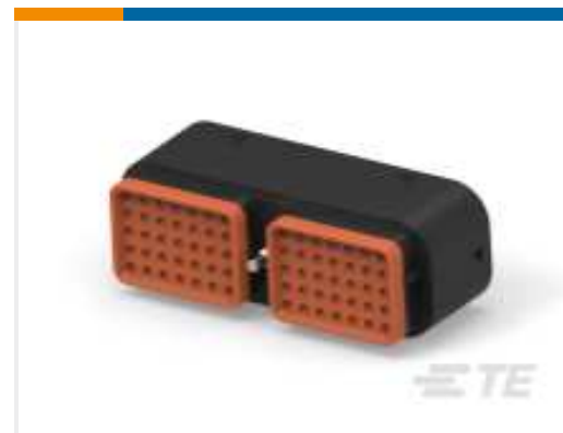
TE Teilnr.:DRC16-70SBE-P013UK PLG, 70P, BLK, E, SEAL BOND, B