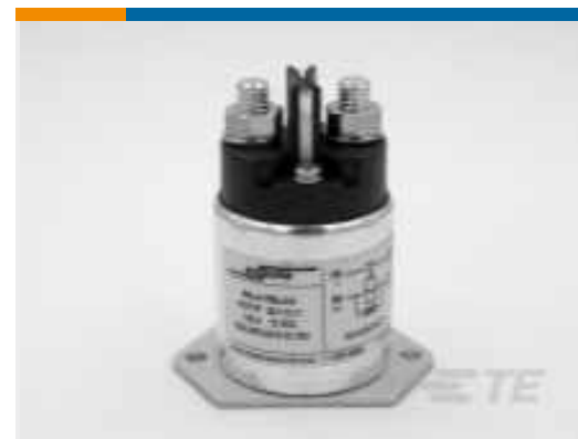
TE Teilnr.:K1060489 Relay 29-113-12