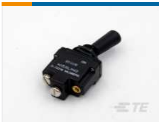
TE Teilnr.:K1007153 Toggle Switch 08-1-1-13