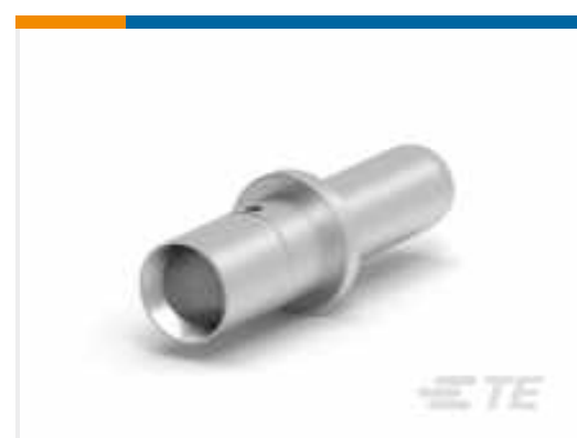
TE Teilnr.:SRK-PC-080-25-601 PIN, SOLID, SIZE M8, 25mm2, AG