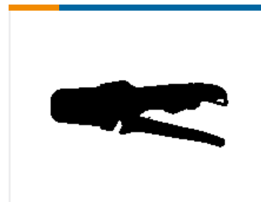
TE Teilnr.:DTT-20-03 CRIMP TOOL