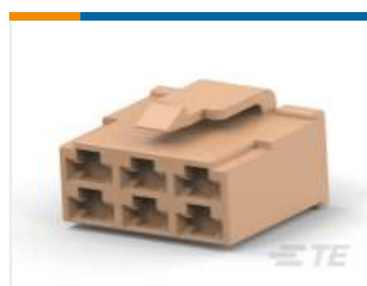
TE Teilnr.: 171898-3 FF 250 PLUG HSG 6P NYLON NAT