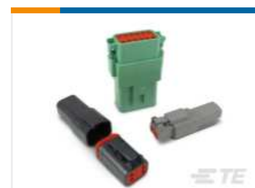
TE Teilnr.:DT04-2P DEUTSCH DT Serie Gehäuse und Steckverbinder