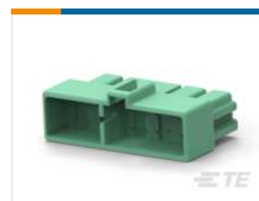
TE Teilnr.: 172137-4 FF 250 REC HSG 10P NYLON NAT