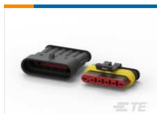
TE Teilnr.:282104-1 AMP SUPERSEAL 1.5MM, STECKVERBINDERGEHÄUSE