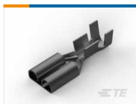
TE Teilnr.: 170258-2 FF 250 REC 14-12AWG TPBR REREELING