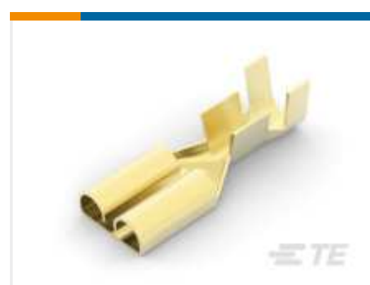
TE Teilnr.: 170258-1 FF 250 REC 14-12AWG BR REREELING