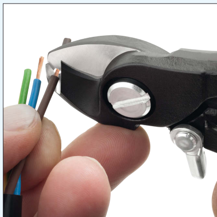
Abisolieren von NYM-Kabeln (3x1,5mm 2 – 5x2,5mm 2 ) Stripping NYM/NM-B wire (3x1,5mm 2 – 5x2,5mm 2 )