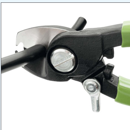
geringer Kraftaufwand, deformationsarmer Schnitt clean and smooth cut without constring or deformation