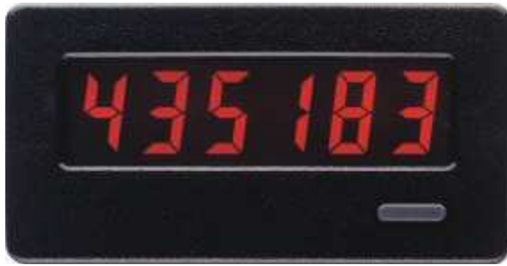
CUB4L in Originalgröße

Der CUB4L ist ein 6-stelliger Zähler mit einer Ziffernhöhe von 12 mm. Er ist mit Standard-LCD oder hintergrundbeleuchteter LCD-Anzeige erhältlich. Der CUB4L mit Standard LCD kann ohne zusätzliche Spannungsversorgung betrieben werden. Bei Geräten mit hinterleuchteter Anzeige kann die hierfür benötigte Spannung von 9 bis 28 VDC über ein aufschraubbares Netzteil (siehe Zubehör) geliefert werden. Die Ziffern leuchten dann intensiv rot bzw. grün-gelb. Die Impulserfassung selbst benötigt keine externe Spannung und wird von einem hochintegrierter CMOS-Zähler-Chip übernommen. Durch die maximale Eingangsspannung des CUB4L von +28 VDC können z.B. Ausgangsimpulse einer SPS direkt gezählt werden.