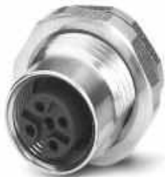
Einbausteckverbinder, 4-polig, Buchse, gerade, M12, A-kodiert, Hinterwandmontage, Pg9, Lötstifte

Bitte beachten Sie, dass die hier angegebenen Daten dem Online-Katalog entnommen sind. Die vollständigen Informationen und Daten entnehmen Sie bitte der Anwenderdokumentation. Es gelten die Allgemeinen Nutzungsbedingungen für Internet-Downloads. ( http://phoenixcontact.de/download )